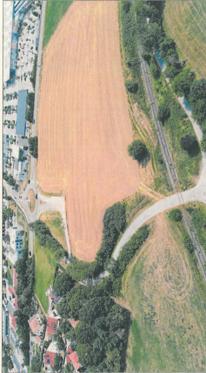
Die Westtangente soll vom Kreisell am südlichen Feuchtwanger Stadtrand (oben) in möglichst gerader Linie über die Bahnlinie führen. Der bestehende Fuß- und Radweg muss laut Rathaus vorläufig nicht weichen.

Westtangente hat laut Ruh für Kommune wichtige Bedeutung – Lärmschutzwall zur Siedlung hin geplant – „Keine nennenswert erhöhten Emissionen zu erwarten“