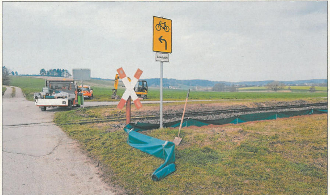
Amphibienschutzzäune hat jetzt der kommunale Bauhof am Bahnübergang unweit der Ungarndeutschen Siedlung angebracht. Die Maßnahme wurde im Vorgriff auf den Bau der Westtangente realisiert.

Dabei gelte es, die „ökologische Funktionalität der neuen Lebensstätten der Zauneidechsen“ kontinuierlich zu sichern. Deshalb seien laut Gutachten des Fachbüros speziell angelegte Ausgleichshabitats, die als Unterschlupf und Sonnenstätte dienten, für die umgesiedelten Amphibien nötig. Insgesamt sechs solcher Ersatzhabitate aus Steinen, Ästen und Zweigen würden die Bauhofmitarbeiter in den kommenden Wochen in der unmittelbaren Umgebung des Bahnübergangs gestalten. Darüber hinaus sei geplant, eine Info-Tafel mit Hinweisen auf die neuen Lebensstätten der Zauneidechsen entlang des Radweges von der Kernstadt nach Kaltenbronn aufzustellen. Im Bereich des Bahnübergangs Westtangente seien gemäß Artenschutzgutachten keine weiteren vorbereitenden ökologischen Maßnahmen zu treffen. Während der Bauphase würden jedoch einzelne Arbeiten auf bestimmte Zeiten beschränkt, um eine mögliche Gefährdung der Fledermaus- und Brutvogelpopulationen sicher auszuschließen.