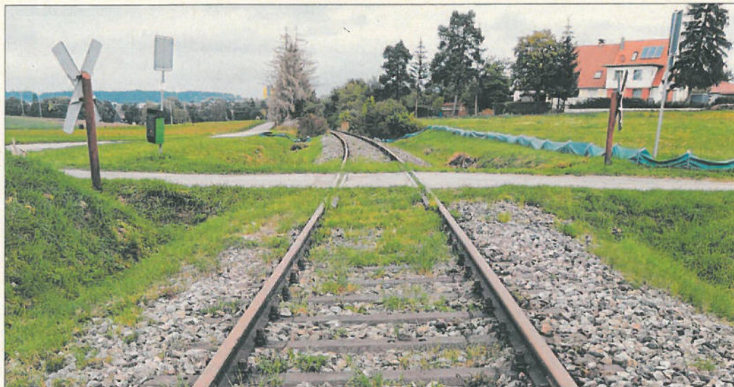
Der Bahnübergang im Süden Feuchtwangens: Die geplante Westtangente soll die Gleise etwa 15 Meter nach Norden versetzt – also auf dem Bild im Bereich hinter dem bestehenden Weg – queren.

Derweil sah Werner Hirsch (Unabhängige Bürgerschaft) beim Bau der Westtangente mögliche Synergieeffekte im Fall der Bahnreaktivierung: Gegebenenfalls ließe sich da eine bessere Anbindung schaffen.